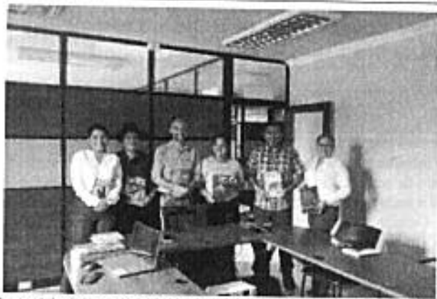
Autoridades que asistieron a la reunión entre el INABIO y la Prefectura de Zamora Chinchipe