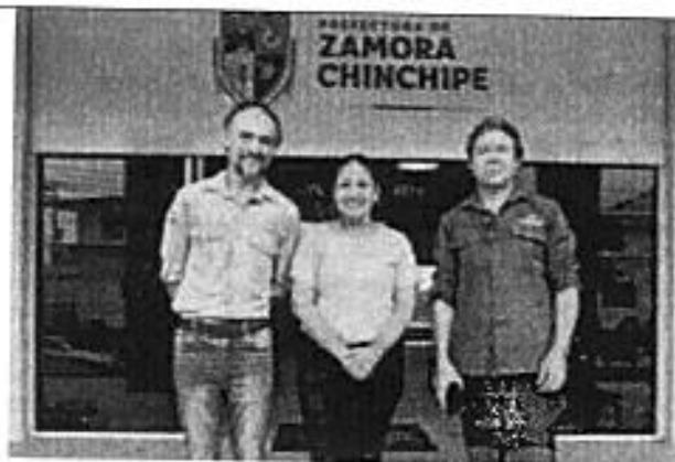
Fotografía de Cierre de la reunión Prefectura de Zamora Chinchipe y el INABIO

La comisión de servicios efectuada a la provincia de El Oro y a Zamora Chinchipe presentaron los siguientes resultados: