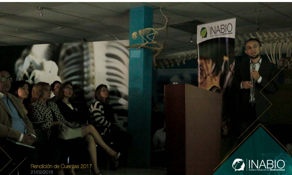
Rendición de Cuentas 2017 21/02/2018