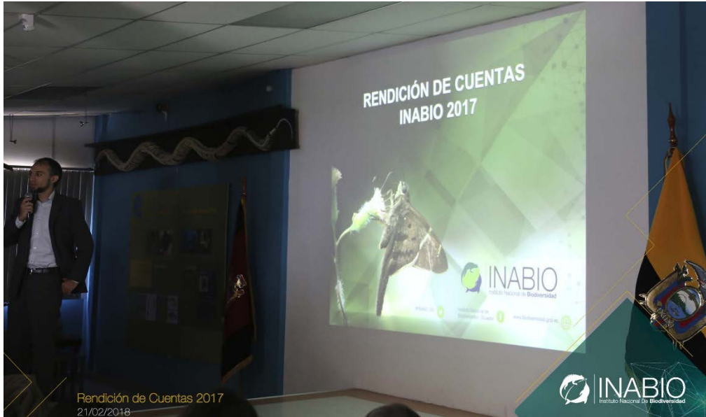
Rendición de Cuentas 2017 21/02/2018