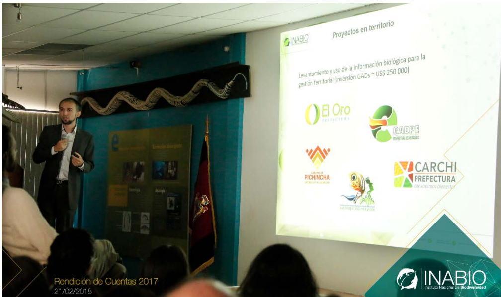
Rendición de Cuentas 2017 21/02/2018