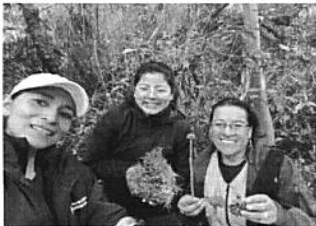
Fotografía 1 Recolección de muestras de hongos (funga)