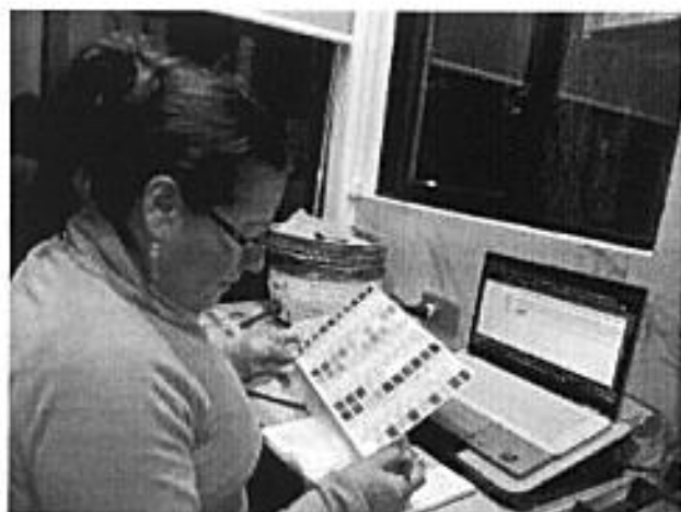
Fotografía 3 Trabajo de descripción de muestras de funga