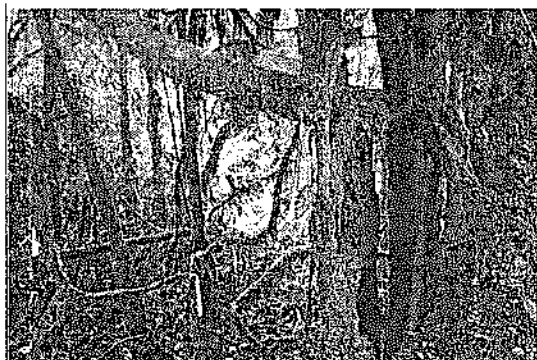
Instalación de trampas Sherman