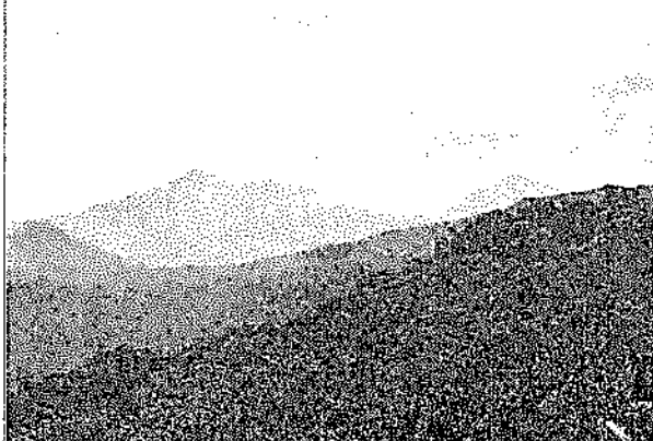
Zona de Estudio Piñán- Cayapas Chupa

07h30 Desayuno 08h30 Traslado hacia la ciudad de Ibarra 12h30 Traslado a Quito 15h45 Llegada a Quito