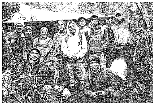
Parte del equipo en el campamento de avanzada Cayapas Chupa