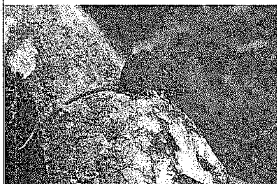
Ratón andino, (especie candidata a nueva)