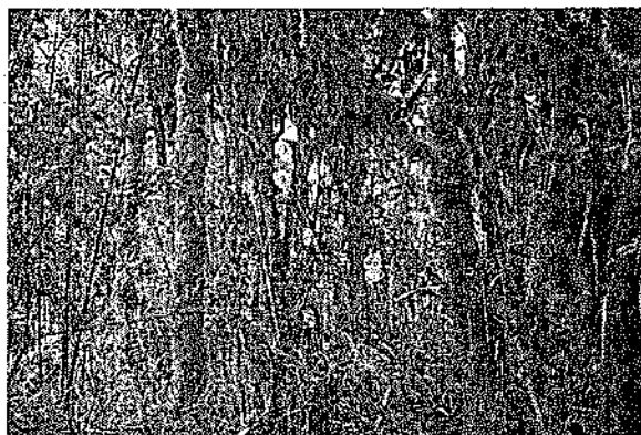
Área de muestreo de mamíferos pequeños