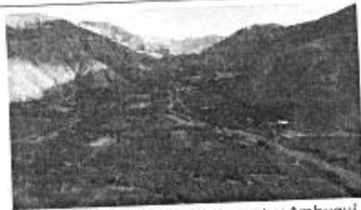
Bosque seco sector Ambuquí