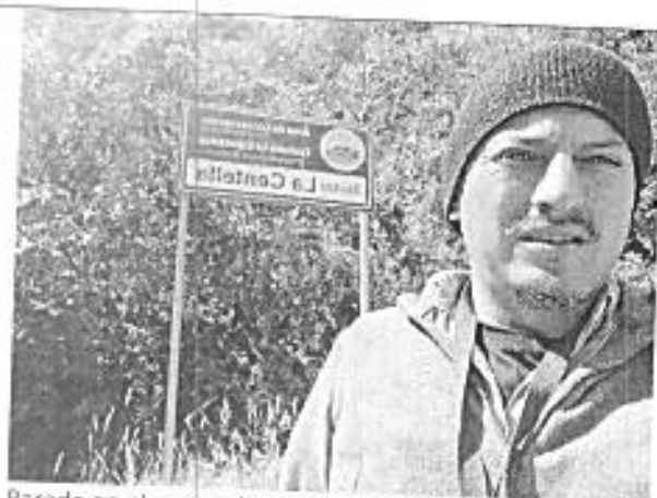
Parada en el sector de La Centella en la carretera Tufiño-Maldonado para toma de fotografías y Videos