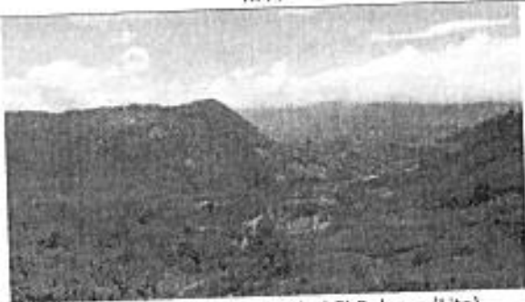
Comunidad El Baboso (Lita)