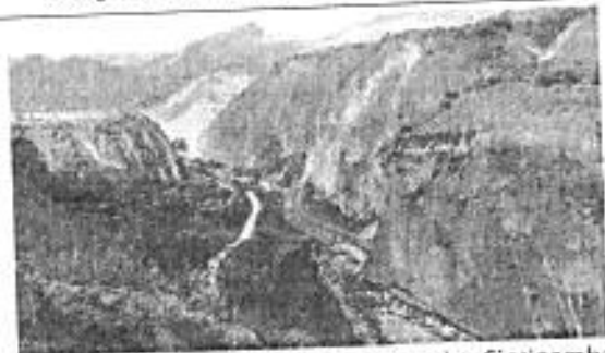
Fotografía RPA: Río Ambi (Via Pimampiro-Sigsipamba)

La comisión de servicios se realizó con éxito en los siguiente puntos: