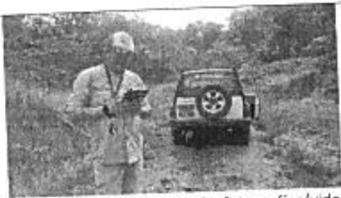
Maniobras de vuelo para toma de fotografías/videos con RPA