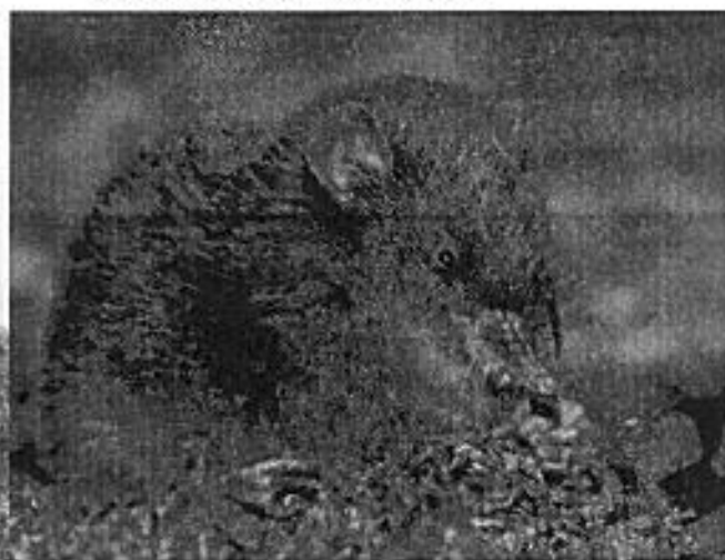
Ratón marsupial ( Caenolestes fuliginosus )