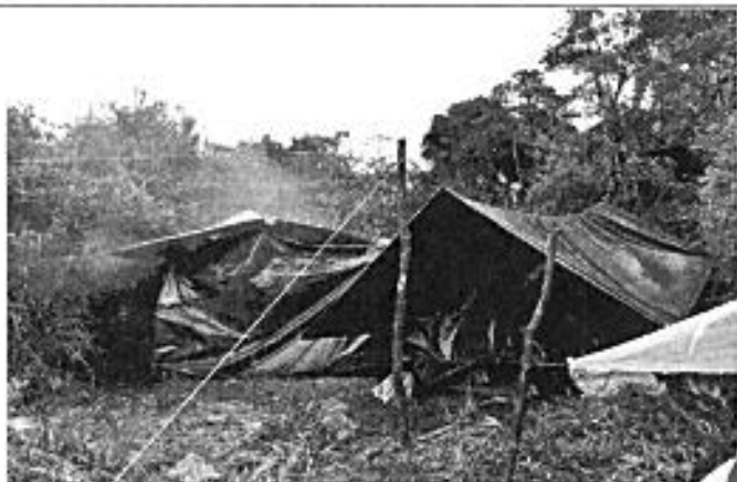
Campamento base (Sabia Esperanza)