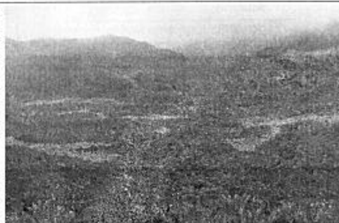
Matorral y páramo de frailejones