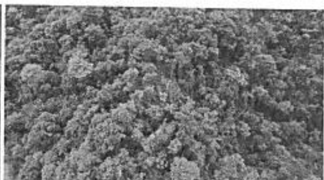
Imagen RAPS del sector Aquepi