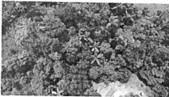
Imagen RAPS del sector Isla de los Monos