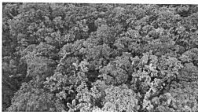
Imagen RAPS del sector La Perla