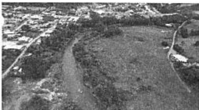
Imagen RAPS del sector Río Baba