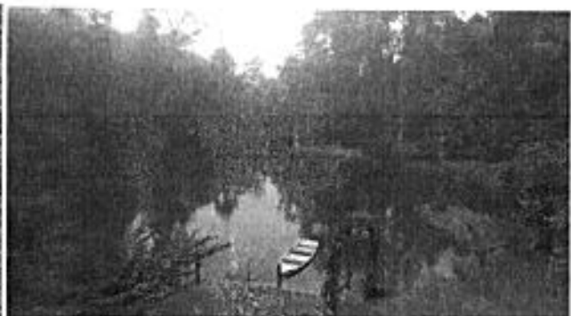
Imagen RAPS del sector El Manantial