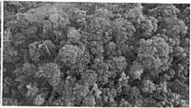
Imagen RAPS del sector Kasama