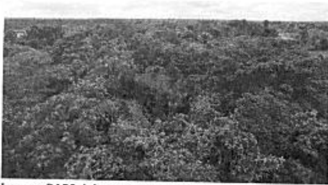
Imagen RAPS del sector Herminia Oronzola