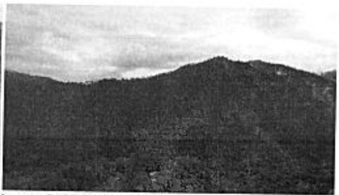
Imagen RAPS del sector Hesperia