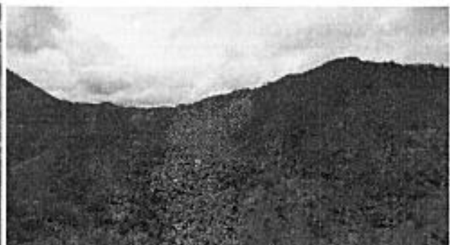
Imagen RAPS del sector Las Palmas

Se obtuvo imágenes y videos con Drones en 11 localidades de la Provincia de Santo Domingo. Las imágenes al igual que los videos incluyen vistas del dosel de la vegetación de los ecosistemas visitados. Los contactos realizados en cada una de las localidades, han permitido gestionar la obtención de material fotográfico importante sobre la flora y fauna, que puede ser incorporada en el libro de biodiversidad de la Provincia.